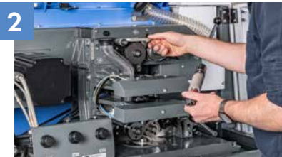
Her parçaya kolay erişim