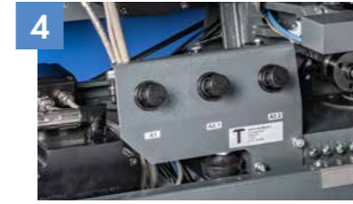
Yeni üst silindir basınç gözetimi