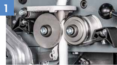
Yeni ölçüm sistemi

IDF 3, müşterilere daha iyi kalite, verimlilik ve kullanımın yanı sıra hızlandırılmış kova değiştirme süreleri ve gelişmiş üretkenlik sağlayan bir dizi yenilikçi özellik sunar.