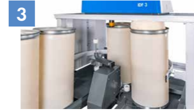
Kova değiştirici oyun değiştirici oluyor